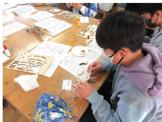
ものづくり体験の様子